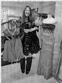
パーティードレスモータ東京表参道店 もレンタル可能だ。 パレンティノのドレス(右)などハイブランドのドレス