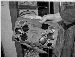
アルマーニのバッグ。レンタルだから選べる派手な色も多めという

東京表参道店(東京都渋谷区、☎0120・952・030)は、常時3000~4000