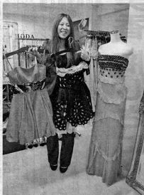
パーティードレスモータ東京表参道店 もレンタル可能だ。 パレンティノのドレス(右)などハイブランドのドレス